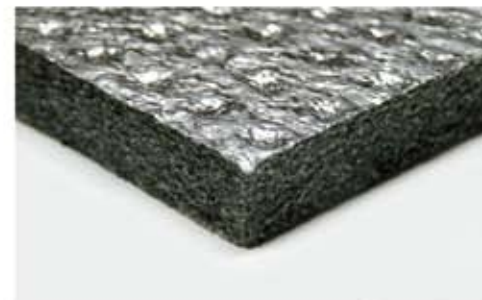
Poliuretano poliestere, densità 25/30 Kg/mc, accoppiato con PE alluminato goffrato.