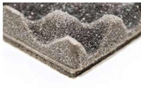
Poliuretano 6 mm + EPDM 3/5 Kg/mq + poliuretano bugnato (o piano) spessore a richiesta.