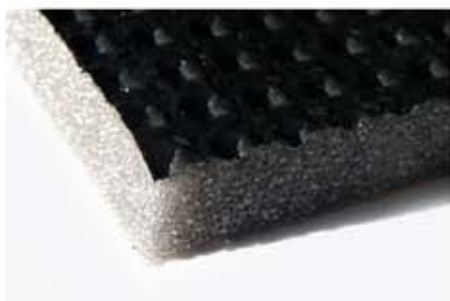
Poliuretano poliestere, densità 25/30 Kg/mc, accoppiato con film PE liscio/goffrato.