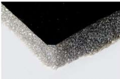
Poliuretano poliestere, densità 25/30 Kg/mc, accoppiato con film PU liscio.