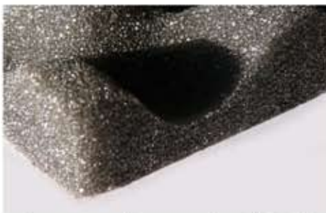
Poliuretano poliestere, densità 25/30 Kg/mc, Bugnato . Spessori mm 10+10, 15+15, 20+20. Altri spess. su richiesta.