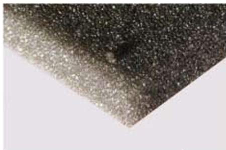
Poliuretano poliestere, densità 25/30 Kg/mc, Piano . Spess. mm 6-10-20-30. Altri spessori su richiesta.