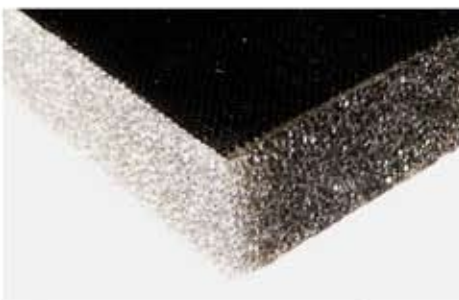
Poliuretano poliestere, densità 25/30 Kg/mc, accoppiato con tessuto vetro.